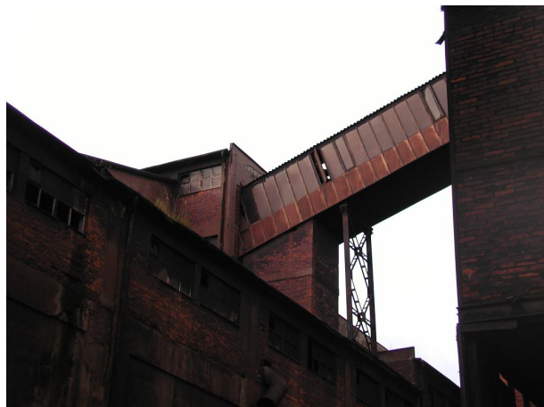
most B11 mezi směšovacími zásobníky a spékárnou