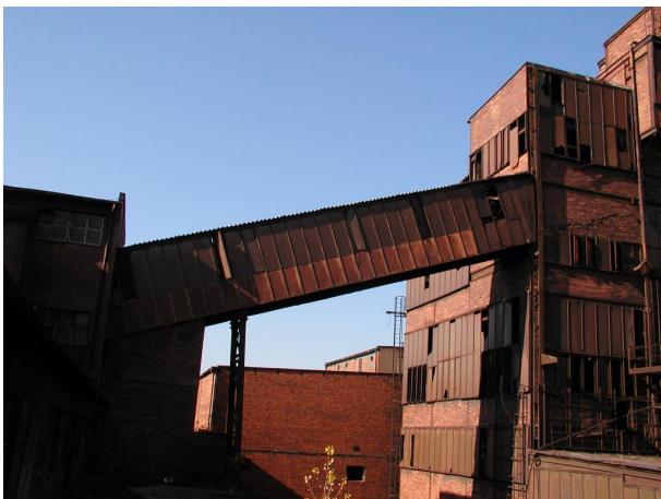
most B11 mezi směšovacími zásobníky a spékárnou