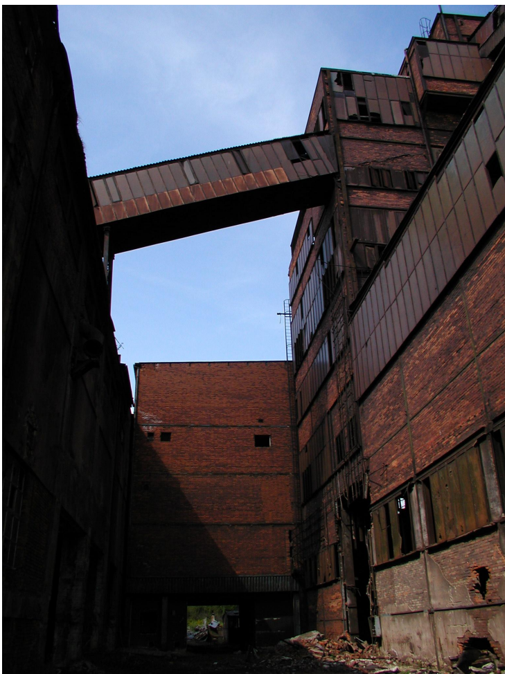
most B11 mezi směšovacími zásobníky a spékárnou