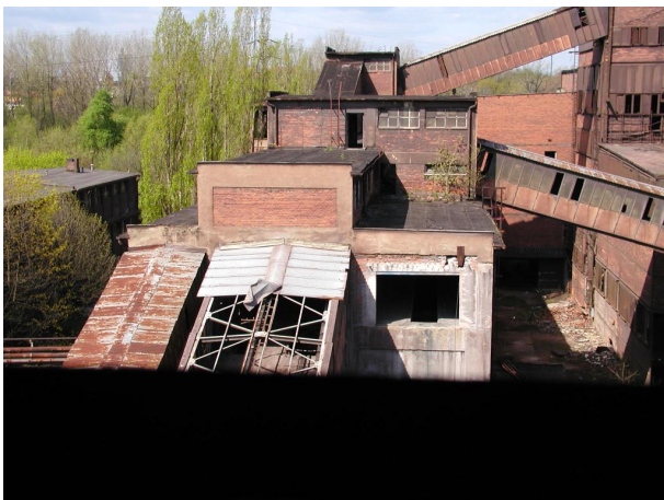
most B11 v pozadí, v popředí mosty 7 a 10, vpravo část mostu 6